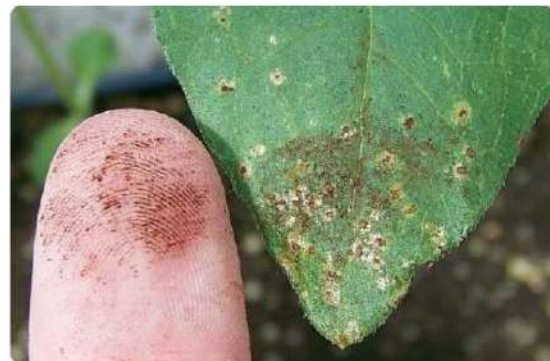
شکل ۴: یوردینیوم های رها شده بر روی انگشت