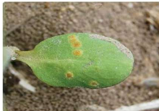
شکل ۱: مرحله اسپرموگونوم زنگ