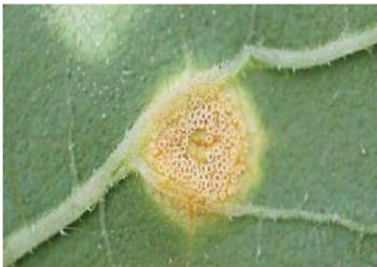
شکل ۲: فنجان های کوچک اسیومی

نشانه ها و علائم: Puccinia helianthi در چرخه زندگی خود دارای ۵ مرحله اسپوری است که ۴ تای آنها با چشم غیر مسلح قابل مشاهده می باشند. مرحله اسپرموگونوم نخستین مرحله از چرخه این زنگ است که به صورت یک لکه زرد تا نارنجی رنگ کوچک روی قسمت های بالایی کوتیلدون ها و یا برگ های پائینی ظاهر می شود (شکل ۱). با پیشرفت بیماری، اسیدیوم ها روی سطح زیرین برگ در مقابل اسپرموگونوم ها تشکیل می شوند. اسیدیوم ها در دسته هایی به صورت فنجان های نارنجی رنگ بوده و از نظر اندازه مشابه اسپرموگونوم ها هستند (شکل ۲).