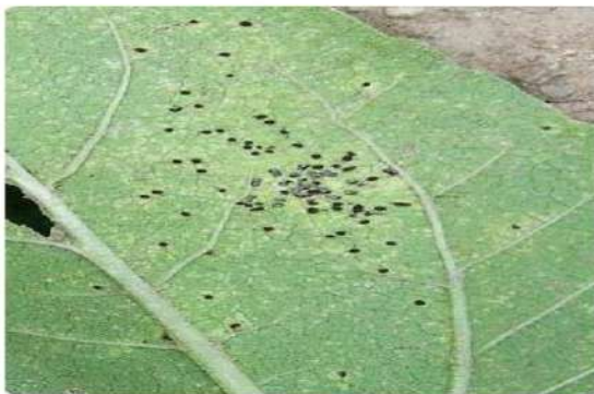
شکل ۵: تلیوم ها

این جوش ها با اسپورهای قهوه ای دارچینی رنگ که اصطلاحاً یوردینیوسپور نامیده می شوند، پر شده اند و ممکن است به وسیله یک هاله زرد رنگ احاطه شوند. این جوش ها به سادگی از سطح برگ رها شده و غباری از اسپورها به صورت رگه قهوه ای رنگ مشاهده می شود (شکل ۴). در پایان فصل، یوردینیوم ها به تلیوم ها تبدیل می شوند (شکل ۵)، که یک ساختمان سیاه رنگ بوده و ثابت هستند.